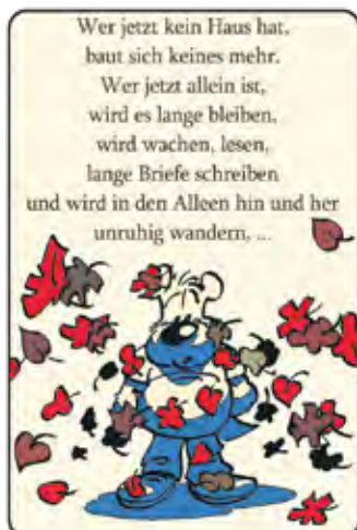
Zeichnung: Matthias Herndorff/SoVD