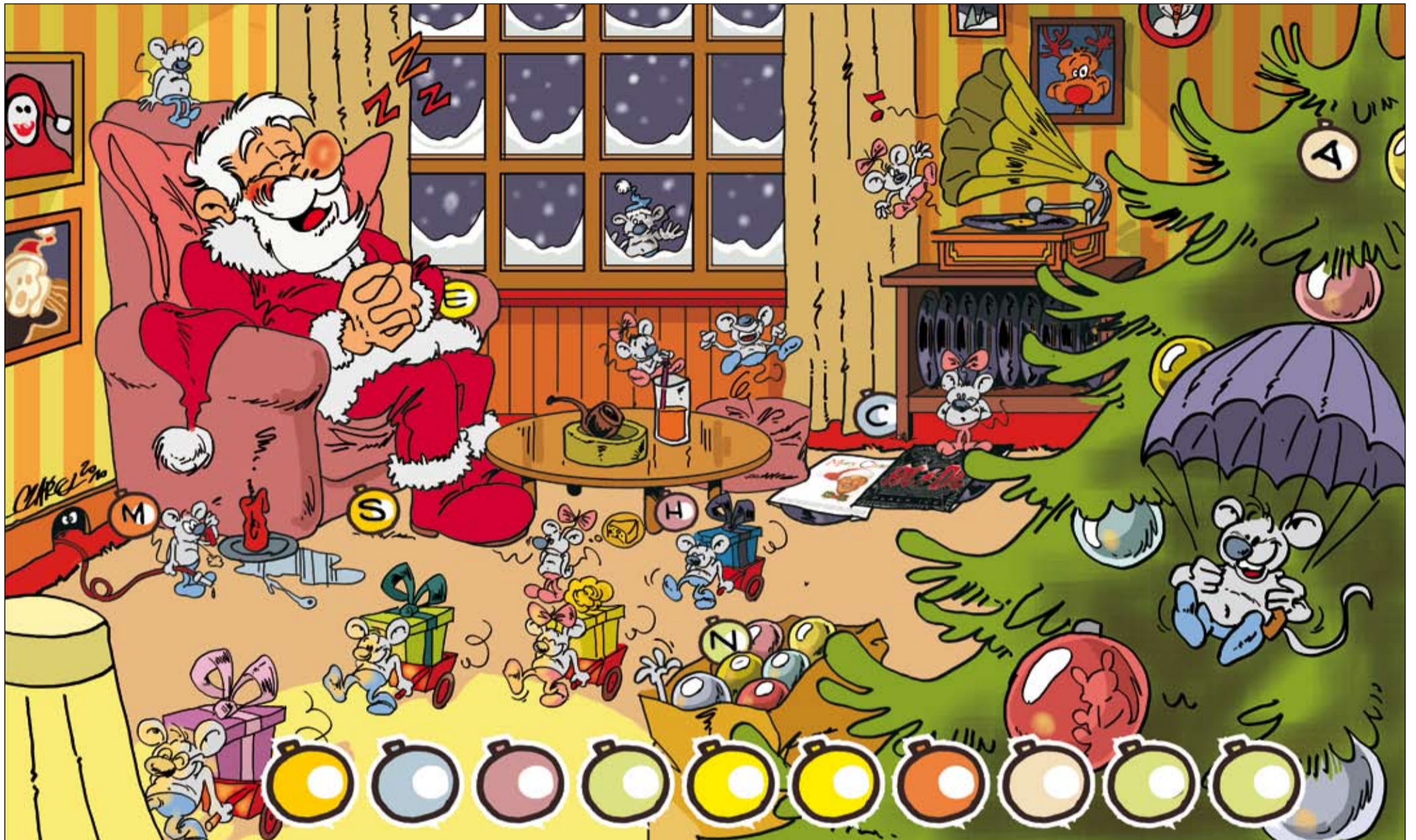
Grafik: Matthias Herrndorff

SoVD, SoVD-Zeitung, Stralauer Straße 63, 10179 Berlin, E-Mail: redaktion@sovd.de (Betreff: Vorweihnachtsrätsel).