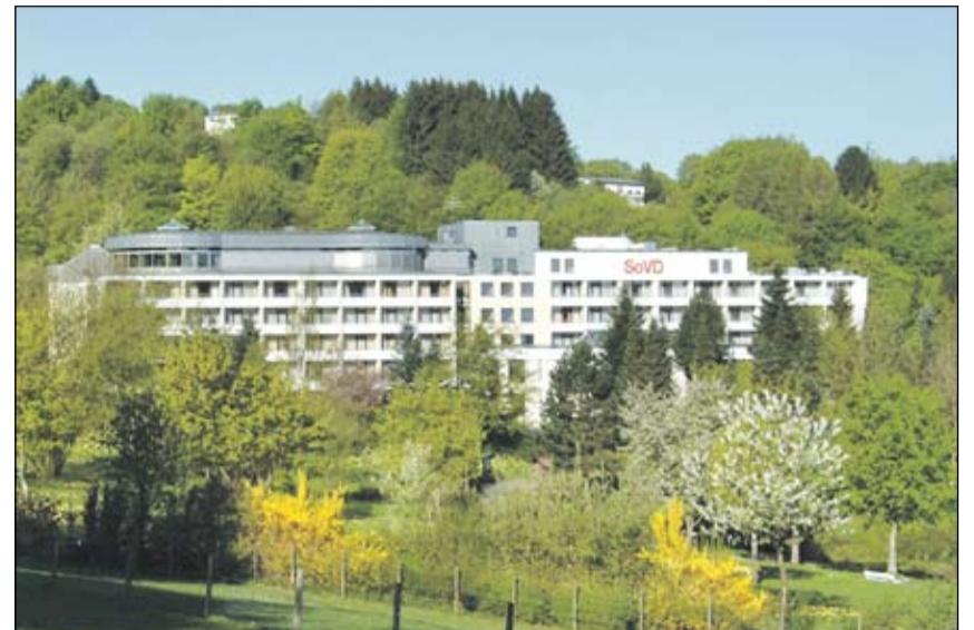
Eingebettet in den Briloner Kurpark im hügeligen Mittelgebirge.