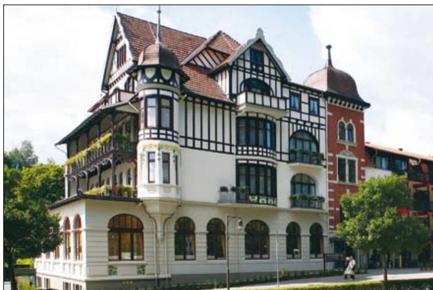
Das im Fachwerkstil errichtete Vital Hotel ist eine Augenweide.

„Die Besonderheit ist, dass unsere zwei Häuser sozusagen verknüpft sind. Alle unsere Gäste können den Service und das Angebot des Vier-Sterne Vital Hotel genießen, auch wenn sie im Drei-Sterne Hotel Haus am Kurpark übernachten. Das gilt nicht nur für unseren Wellnessbereich“, so Direktor Jörg Steinhäuser und gibt den Hinweis: „Beispielsweise kann die Halbpension im À-la-carte-Restaurant angerechnet werden. Viele Gäste nutzen das, um den letzten Abend ihres Urlaubes besonders zu gestalten oder einen Geburtstag zu feiern.“ Beide dieser genannten Möglichkeiten sind sehr reizvoll. Der 700m 2 große Spa- und Wellnessbereich verspricht Erholung in Reinkultur. Mit August dieses Jahres kommen Gäste in den Genuss der einzigartigen Produkte des Kräuterparks Altenau. So verwöhnen im Bio Sanarium wohltuende