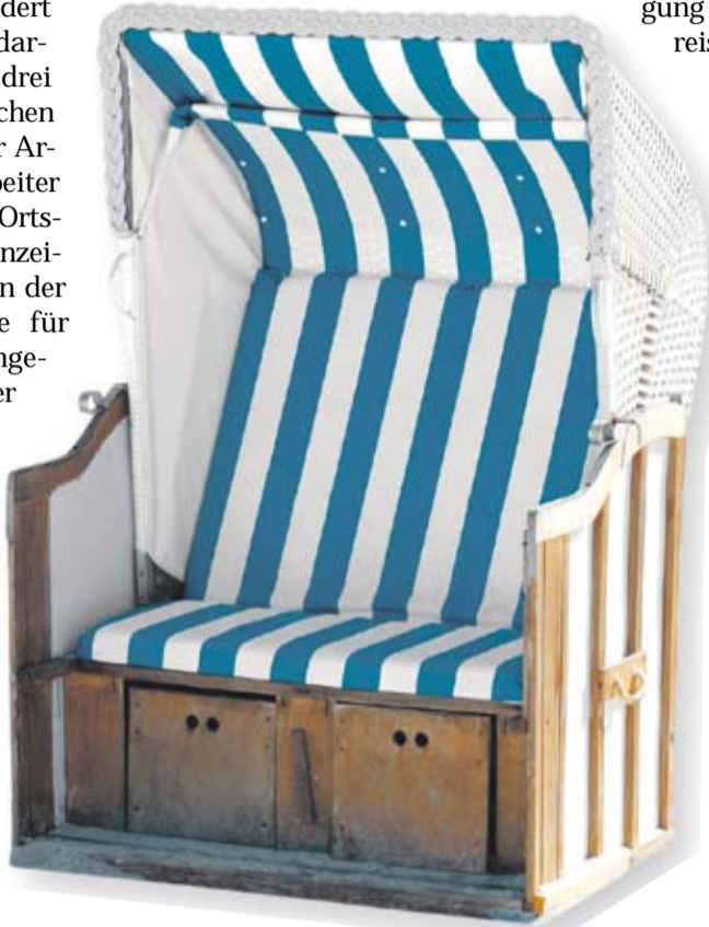
Wird das Jobcenter rechtzeitig informiert und erteilt seine Zustimmung, können auch Arbeitssuchende ihren Strandurlaub genießen.

Beispiel vier Wochen bleibt, der bekommt nur für drei Wochen das Arbeitslosengeld weitergezahlt. Urlaub, der über sechs Wochen hinausgeht, führt sogar zum Verlust des