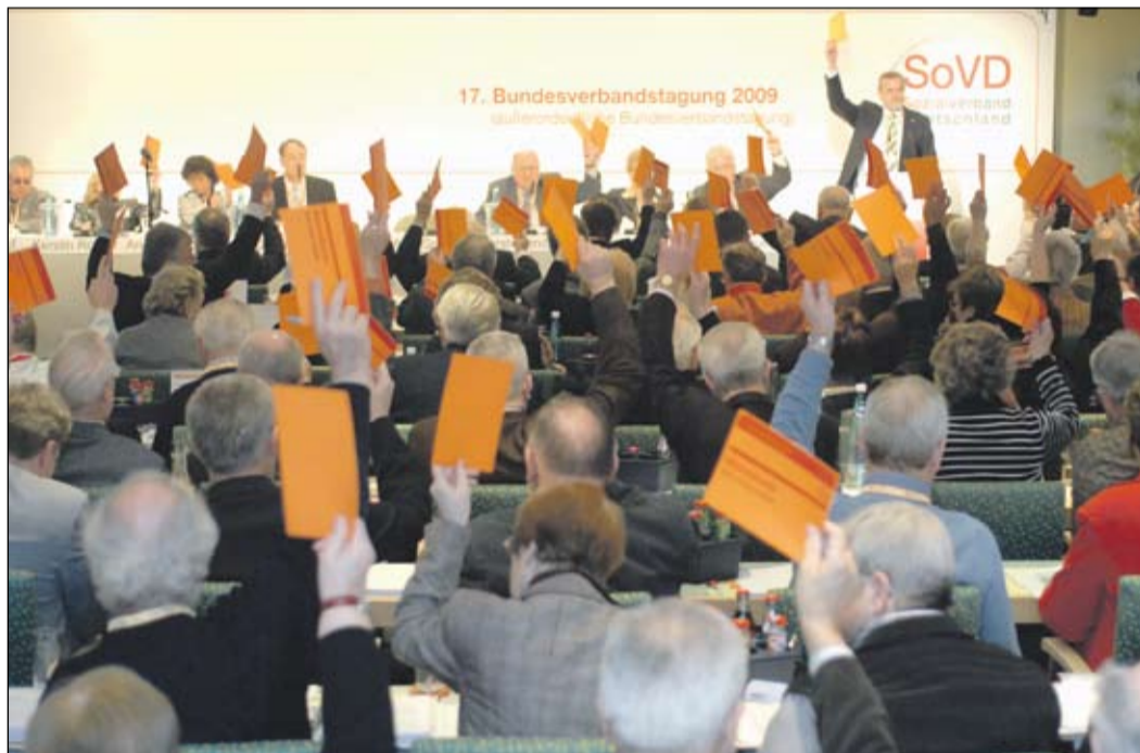
Mit nur fünf Gegenstimmen verabschiedeten die 199 Delegierten der 17. SoVD-Bundesverbandstagung eine Modernisierung der Satzung.