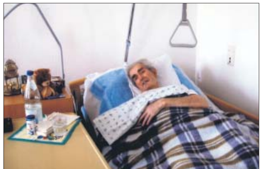
Auch um bettlägrige Heimbewohnerinnen und Heimbewohner kümmern sich die Mitglieder des Ortsverbandes Mannheim-Neckarau, indem sie beispielsweise vorlesen.