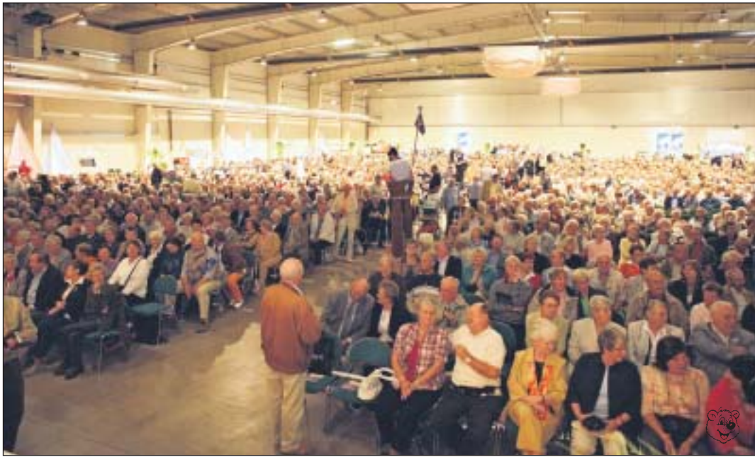
Die Holstenhalle in Neumünster war mit rund 3800 Besucherinnen und Besuchern bis auf den letzten Platz gefüllt.