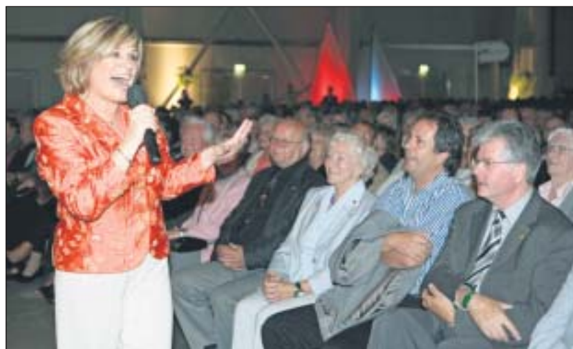
Mary Roos, seit Jahrzehnten aus dem deutschen Schlagergeschäft nicht mehr wegzudenken, verzauberte ihr Publikum.

Sie helfen anderen mit Rat und Tat. Sie engagieren sich oft schon seit Jahrzehnten für unseren SoVD. Sie kämpfen gegen Vereinsamung und für Mitmenschlichkeit und Solidarität. Sie tun dies alles meist leise im Hintergrund und ohne viel Aufhebens um die eigene Person zu machen. Es war an der Zeit, ihnen einmal Dank zu sagen, und wie könnte man dies besser als mit einem großen Fest. Auf Einladung des schleswig-holsteinischen Landesverbandes kamen rund 3800 ehrenamtliche Mitarbeiterinnen und Mitarbeiter in die Neumünsteraner Holstenhalle und verbrachten gemeinsam einen unvergesslichen Nachmittag. Unvergesslich wird dieser Tag vor