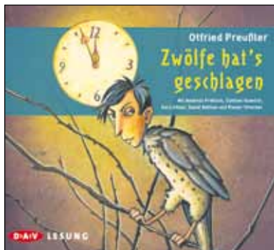
Preußler, Otfried: Zwölfe hat's geschlagen. Der Audio Verlag, 2 CDs, Laufzeit 141 Minuten, ISBN: 978-3-86231-242-9, 14,99 Euro.