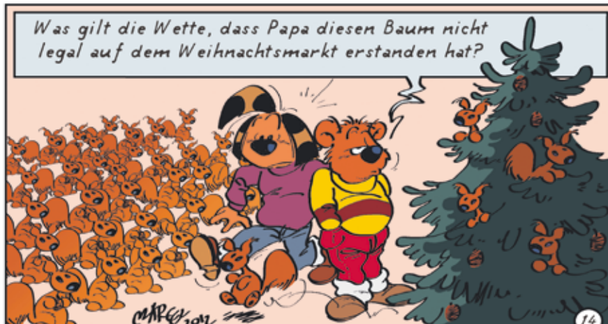
Zeichnung: Matthias Herrndorff/SoVD