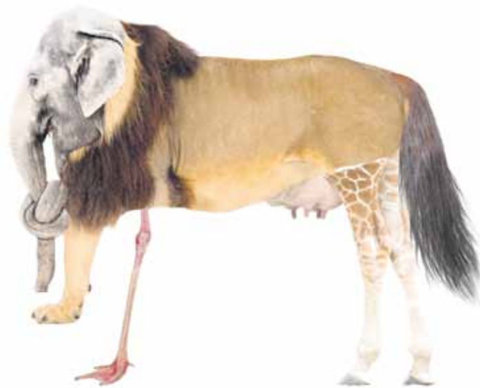
Für alle Biologielehrer: Dieses Tier gibt es nicht wirklich!

Die Auflösung dieses vertrackten Rätsels findest du wie immer auf Seite 18.