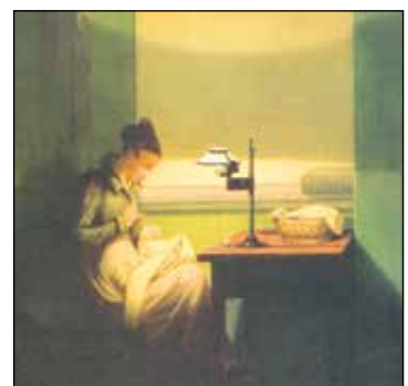
Gemälde: Georg Friedrich Kersting Welche Geheimnisse verbirgt wohl dieses Kästchen?

Geheim waren weniger die Dinge, die sich erwartungsgemäß in einem solchen Nähkästchen befanden. Allerdings versteckten Frauen in früheren Zeiten dort gerne solche Dinge, die sie etwa vor ihren Ehemännern geheim halten wollten – zum Beispiel die Liebesbriefe anderer Verehrer. Trafen sich die Frauen untereinander zum Nähen, dann wurde gerne einmal der ein oder andere Brief hervorgeholt und damit vor den