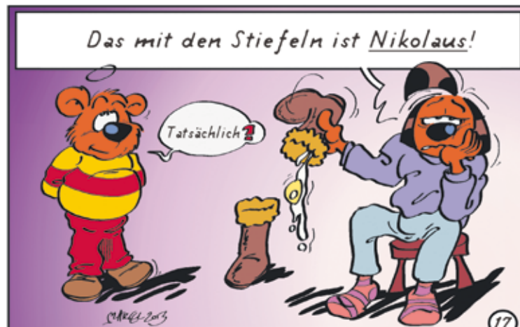
Zeichnung: Matthias Herrndorff/SoVD