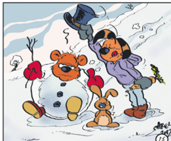
Zeichnung: Matthias Herrndorff/SoVD