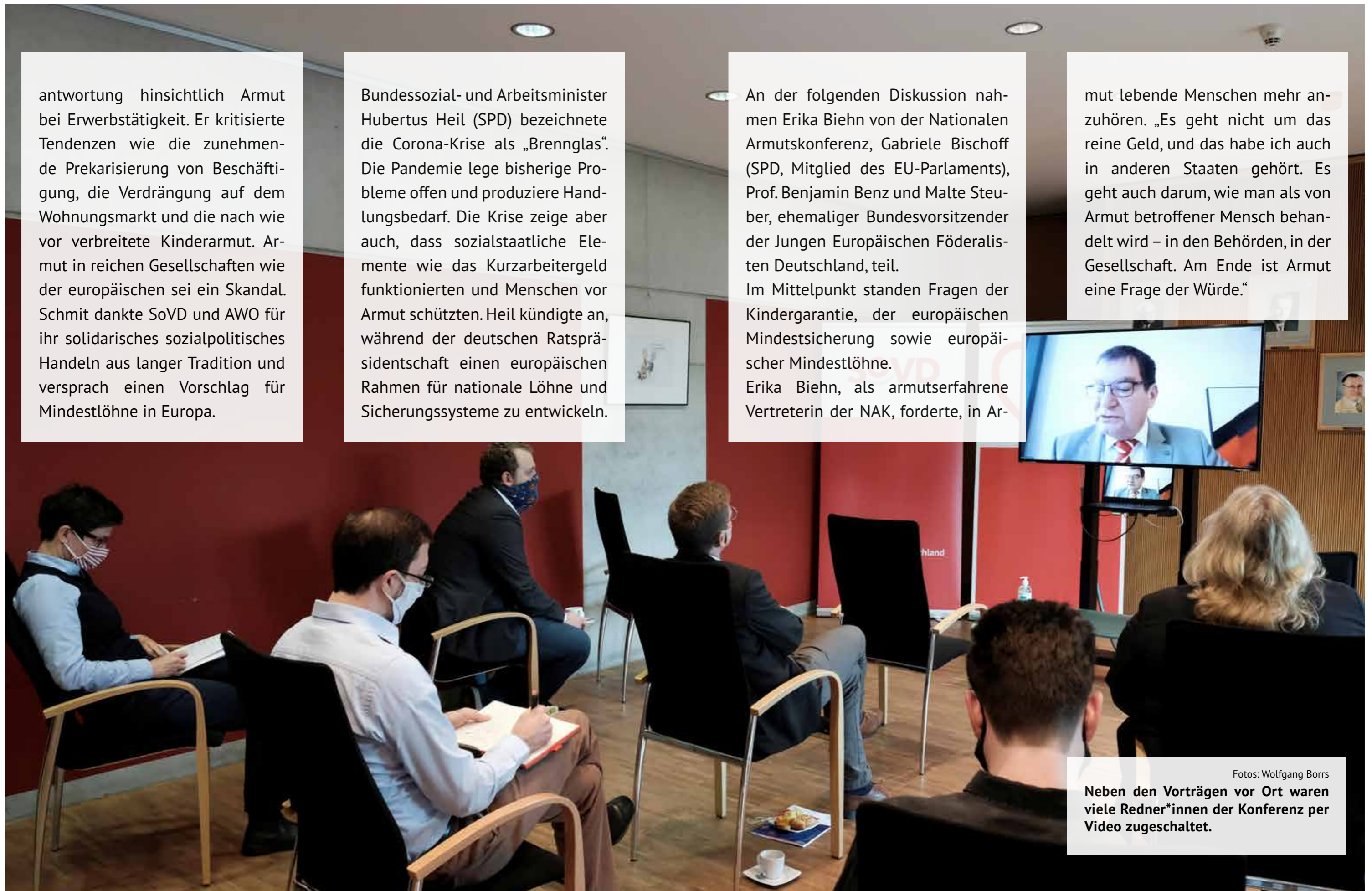
Neben den Vorträgen vor Ort waren viele Redner*innen der Konferenz per Video zugeschaltet.

mut lebende Menschen mehr anzuhören. „Es geht nicht um das reine Geld, und das habe ich auch in anderen Staaten gehört. Es geht auch darum, wie man als von Armut betroffener Mensch behandelt wird – in den Behörden, in der Gesellschaft. Am Ende ist Armut eine Frage der Würde.“